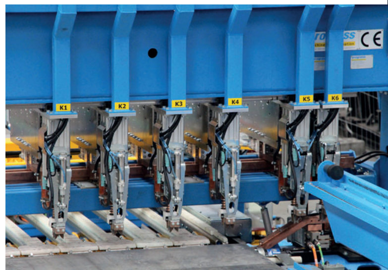
Die Schweißmaschine ist eine flexible Produktionsanlage für Bewehrungsmatten direkt ab Coil und kann so individuelle Spezifikationen realisieren.