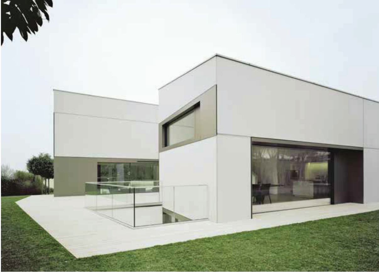
Figure: Beton Kemmler

Beton Kemmler GmbH supplies the latest precast concrete elements for highest living standards