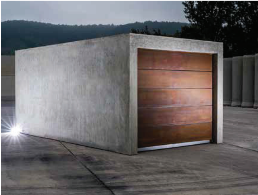
Figure: Beton Kemmler

An example of particular innovative power: the Kemmler garage „Beton brut“ shows a puristic garage design